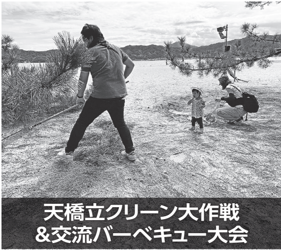
天橋立グリーン大作戦 & 交流バーベキュー大会

府本部は9月23日、京都市北部・天橋立で天橋立グリーン大作戦&交流バーベキュー大会を開催。府内各単組から組合員や家族など44人が参加した。天橋立は5000本の松並木と白い砂「白砂青松」が約3・6km続く。年間約300万人の