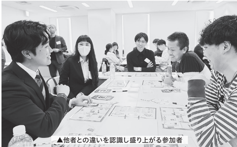
▲他者との違いを認識し盛り上がる参加者

府本部は2月17日、京都商工会議所で「ユニオンカレッジ」やりたいたいことを組合で実現しよう」の第4弾となる「2024仲間づくりセミナー」を開催。公務員人生ゲームを活用した交流を通じて、新規採用職員や非組合員の加入に向けたヒントを得ることを目的とし、11単組39人が参加した。