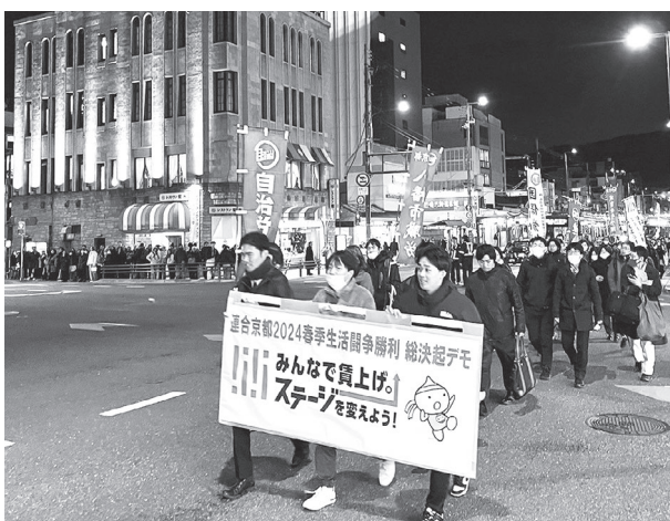
▲山山公園から京都市役所前までデモ行進

連合京都は3月1日、山山公園野外音楽堂で2024春季生活闘争勝利総決起集会を開催。25